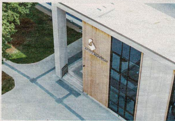
„Stansefabrikken“ atidarė naują gamyklą, kurioje įrengta viena moderniausių technologinių linijų Lietuvoje.

žiūros specialistų stygiaus taip pat kol kas nejauciame, tačiau situaciją atidžiai stebime.