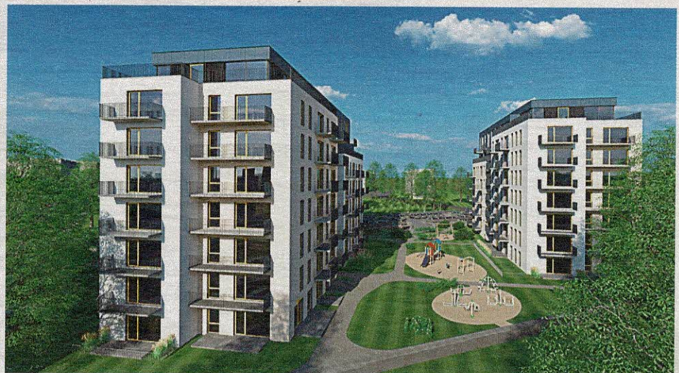
Netoli pagrindinių šalies miestų įsikūrusi Ukmergė dėl vietos savivaldos pastangų tapo verslo traukos centru. O įkandin skuba ir nekilnojamojo turto plėtotojai – čia planuojami nauji daugiabučiai.

PASKATOS. Savivaldos pastangos pritraukti į miestą įmones bei naujus darbuotojus puikiai atsiperka